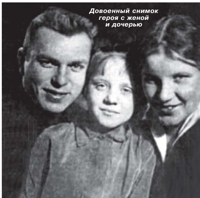
Довоенный снимок героя с женой и дочерью