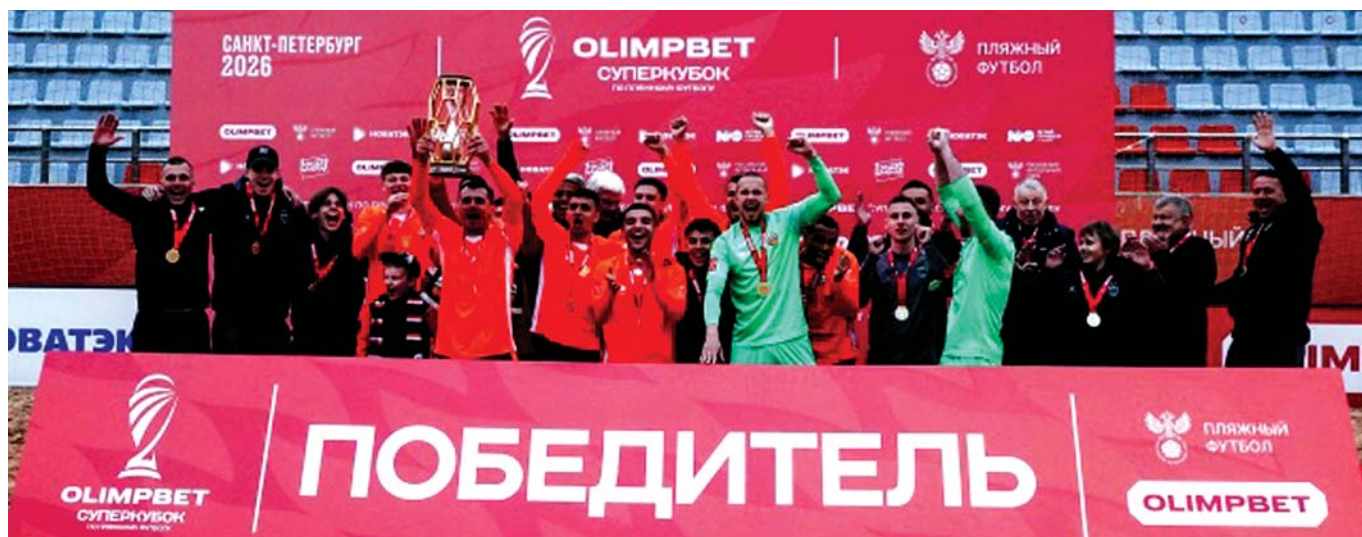
Победив 27 мая на СК «Новая арена» МФК «Саратов» со счётом 7:4, петербургский «Кристалл» в 4-й раз подряд завоевал Суперкубок России, с чем мы его и поздравляем