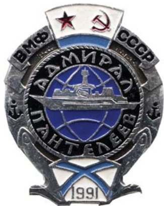
Редкий знак из коллекции

В Гангэ вышли утром вместе с попутчиками — двумя небольшими яхтами из Выборга. Несмотря на то что последние два дня солнце садилось в тучу, погода оставалась чудесной. Так и дальше будет, говорил дядя, накануне напомнивший, что погоду предсказывать нужно не по одному признаку: раз ветер к вечеру стихает, баро-